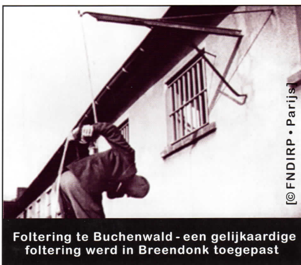
Foltering te Buchenwald - een gelijkaardige foltering werd in Breendonk toegepast

«De ondervraging onder druk, het is te zeggen, met foltering... Over het algemeen werd men opgehangen en deed men uw broek afdoen. Ik excuseer mij voor de details, maar goed. Dit deed men vermoedelijk om te zien of men van joodse origine was maar vooral om wat er ging volgen als ongeluk. (...) de klassieke foltering bestond uit de ophanging